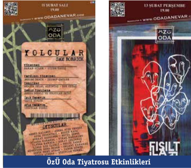
ÖZÜ Oda Tiyatrosu Etkinlikleri

10-14 Şubat tarihleri arasında gerçekleşen Welcome Back'te dağcılık fotoğraf sergisinden ebru sergisine; akustik konserden kağıt uçak yarışmasına; tiyatro oyunlarından film gösterimlerine, Türk Müziği konserinden Çin Çayı seremonisine kadar pek çok farklı kültürel ve sanatsal etkinlikle bir araya geldik. Tüm bu etkinliklere ilaveten düzenlenen oturum ve konuşmaların yanı sıra Kadın Çalışmaları Kulübümüzün Kadınlara Yönelik Şiddet konusundaki bilinçlendirme çalışmalarını da hem faydalı hem dopdolu bir süreç geçirdik.