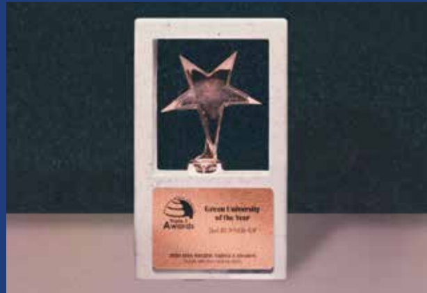
"Yeşil Üniversite" kategorisinde ÜÇÜNCÜLÜK ÖDÜLÜ