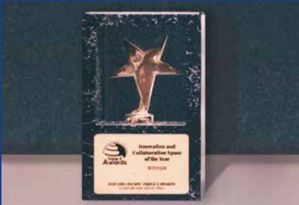
ÖzÜ-X Binası ile "Yenilikçilik ve İş Birliği Mekânı" kategorisinde BİRİNCİLİK ÖDÜLÜ

Hindistan'da düzenlenen ödül töreninde, Asya-Pasifik bölgesindeki tüm üniversiteler arasında üniversitemiz, ÖzÜ-X Binası ile "Yenilikçilik ve İş Birliği Mekânı" kategorisinde BİRİNCİ, "Yeşil Üniversite" kategorisinde ÜÇÜNCÜ olurken, EÇEM'in NextGEN Projesi ile "Toplumsal Sorumluluk Girişimi" kategorisinde ONURSAL MANSİYON'un sahibi oldu.