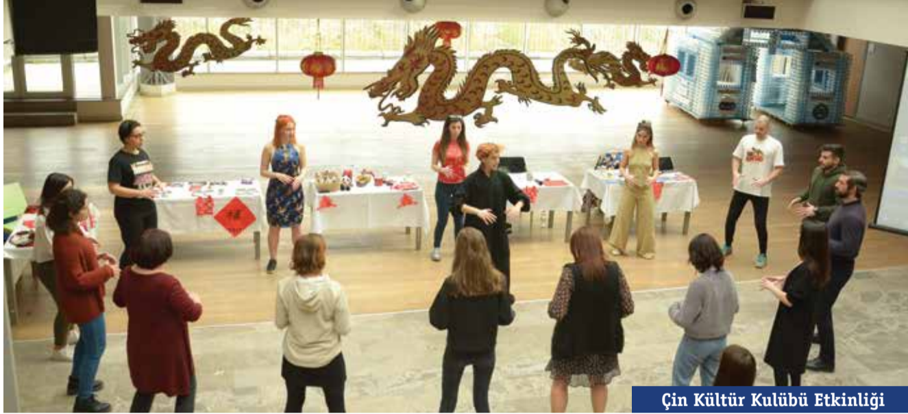
Çin Kültür Kulübü Etkinliği

10-14 Şubat tarihleri arasında gerçekleşen Welcome Back'te dağcılık fotoğraf sergisinden ebru sergisine; akustik konserden kağıt uçak yarışmasına; tiyatro oyunlarından film gösterimlerine, Türk Müziği konserinden Çin Çayı seremonisine kadar pek çok farklı kültürel ve sanatsal etkinlikle bir araya geldik. Tüm bu etkinliklere ilaveten düzenlenen oturum ve konuşmaların yanı sıra Kadın Çalışmaları Kulübümüzün Kadınlara Yönelik Şiddet konusundaki bilinçlendirme çalışmalarını da hem faydalı hem dopdolu bir süreç geçirdik.