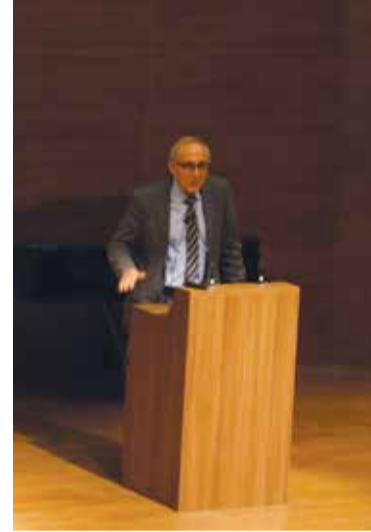
Şair-Yazar Ataol Behramoğlu ile Konferans ve İmza Günü