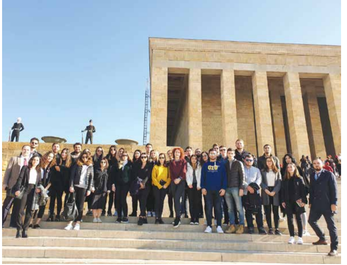
Hukuk Fakültesi Öğrencilerimizin Anıtkabir Ziyareti

Bununla birlikte Ulu Önder Atatürk'ü anma haftası boyunca Hukuk Fakültemiz tarafından düzenlenen etkinliklerde de bir araya geldik. 6 Kasım 2019'da Atatürk'ün Kütüphanecisi ve Çankaya Köşkü Özel Kalem Müd. Yrd. Nuri Ulusu'nun oğlu, araştırmacı, yazar Mustafa Kemal Ulusu ile Konferans ve İmza Günü ile başlayan etkinlikler, 11 Kasım 2019'da Şair - Yazar Ataol Behramoğlu ile Konferans ve İmza Günü ile devam ederek, 15 Kasım 2019'da 26. Genelkurmay Başkanı (E.) Org. İlker Başbuğ'un "ATATÜRK" başlıklı Konferansı ile sona erdi.