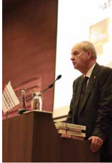
26. Genelkurmay Başkanı (E.) Org. İlker Başbuğ "ATATÜRK" Konferansı