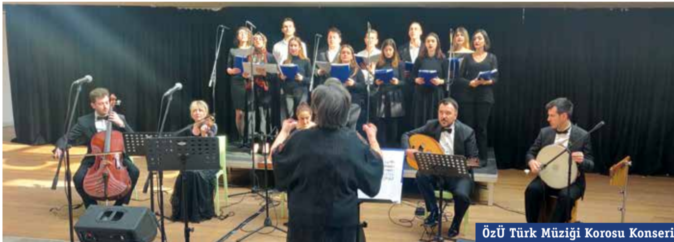
ÖzÜ Türk Müziği Korusu Konseri