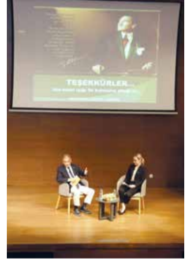
Araştırmacı Yazar Mustafa Kemal Ulusu ile Konferans ve İmza Günü