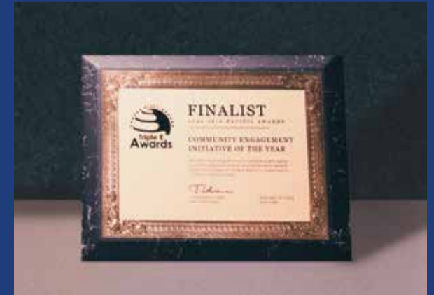
EÇEM'in NextGEN Projesi ile "Toplumsal Sorumluluk Girişimi" kategorisinde ONURSAL MANSİYON ÖDÜLÜ