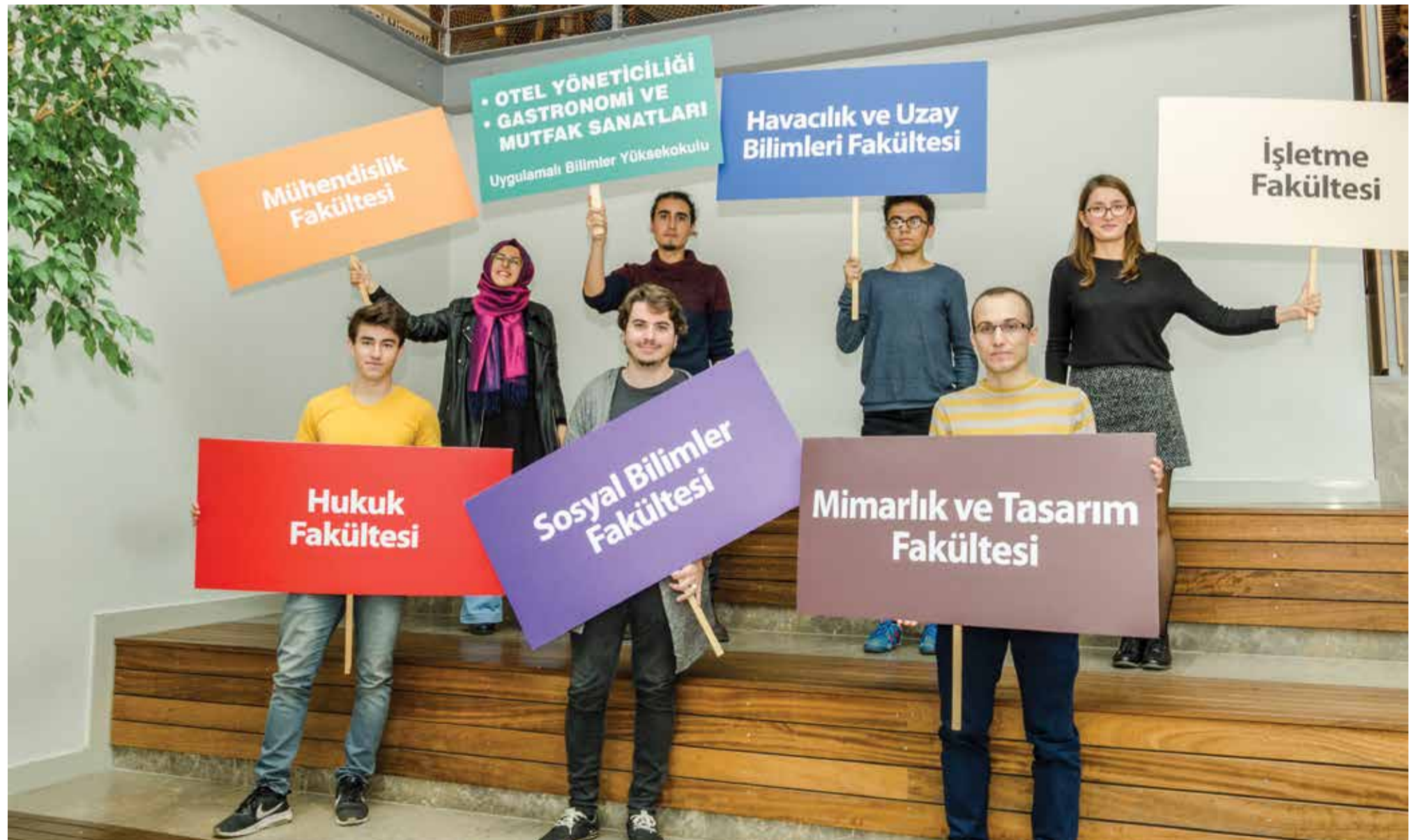
* 2018-2019 Akademik Yılı Fakülte ve Yüksekokullarımıza En Yüksek Başarı Sıralaması ile Yerleşen Öğrencilerimiz