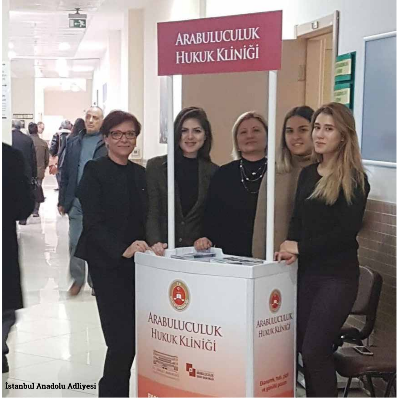
İstanbul Anadolu Adliyesi

Mahkeme dışı uyuşmazlık çözüm yolları Türkiye'de yaygın bir şekilde kullanılmıyorsa da son yıllarda arabuluculuk kurumuyla gündeme geldi. Özyeğin Üniversitesi de bu dönem Adalet Bakanlığı ile birlikte Arabuluculuk Hukuk Kliniği projesini gerçekleştirdi. İstanbul Anadolu Adliyesi'nde, 15 Şubat - 15 Mayıs 2017 tarihleri arasında yapılan Arabuluculuk Hukuk Kliniği uygulamasına toplam 14 öğrenci katıldı. Adliyede oluşturulan başvuru noktasında