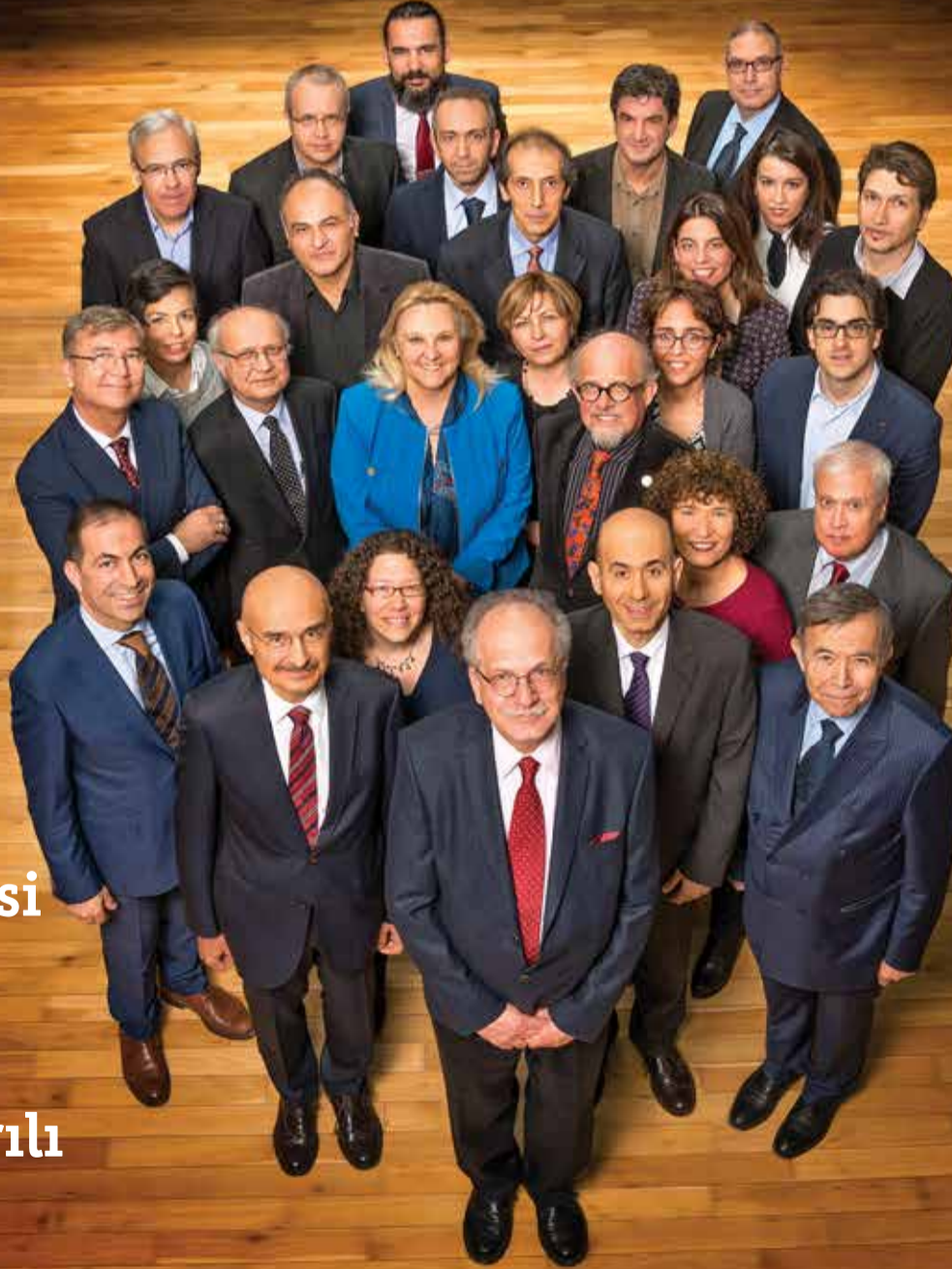
2017 Akademik Yönetim Kadrosu