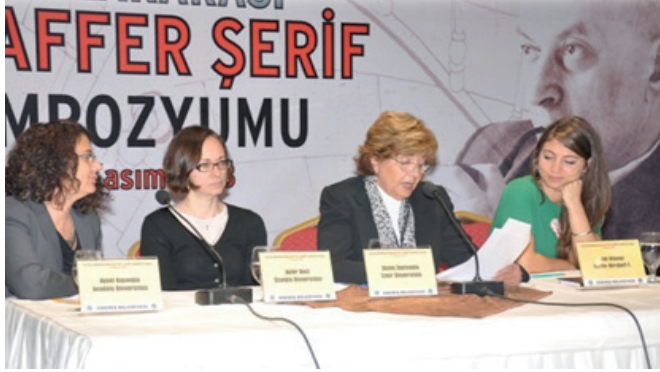
Uluslararası Muzaffer Şerif Sempozyumu